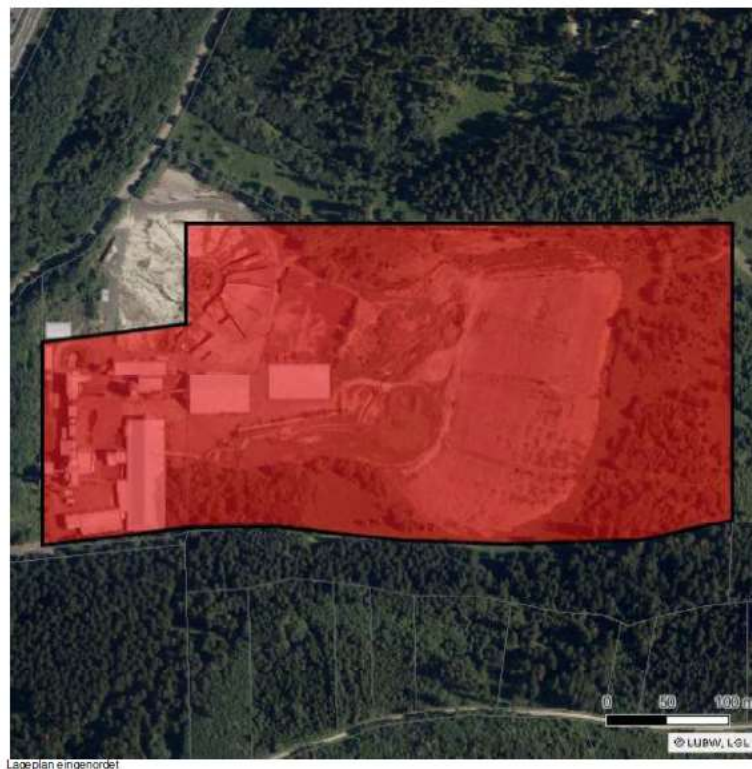
Abb. 1: Altstandort, Flächen-Nr. 03400-000

Im Zuge des Scoping-Termin am 03. März 2021 äußerte sich das Amt für Umwelt, Wasser- und Bodenschutz (AUWB) in Hinblick auf den behördenseitig geführten Altstandort AS Liapor GmbH & Co. KG, Flächen-Nr. 03400-000. Die Altstandortfläche umfasst Teilbereiche des zukünftigen Bebauungsplan-Gebietes und der zukünftigen Erddeponie DK 0. Siehe hierzu Abbildung 1: